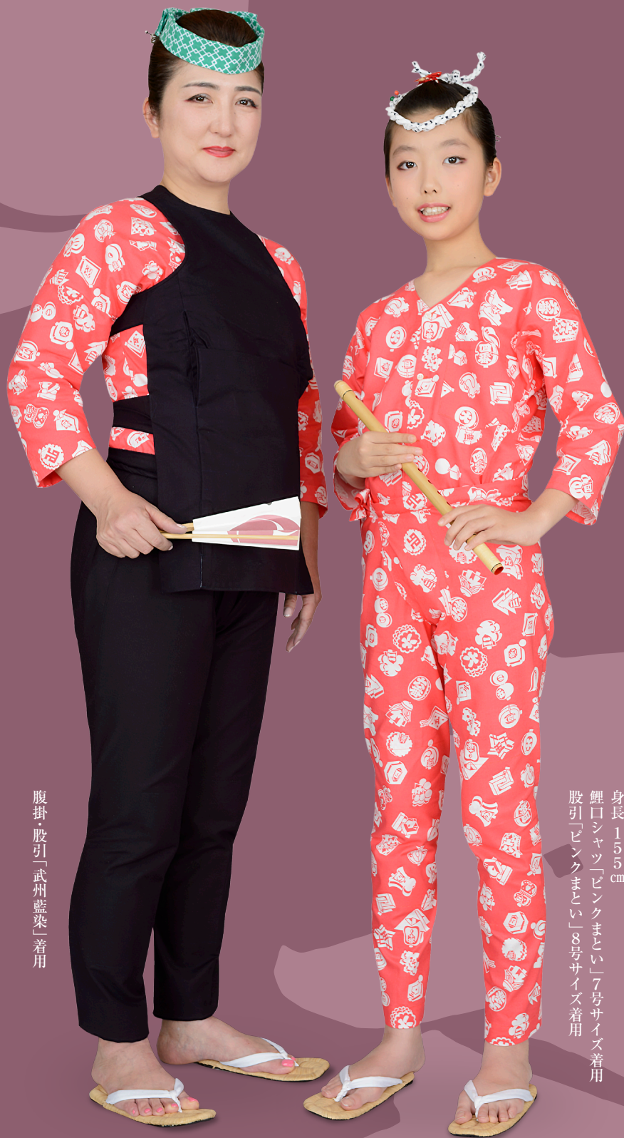
腹掛・股引「武州藍染」着用