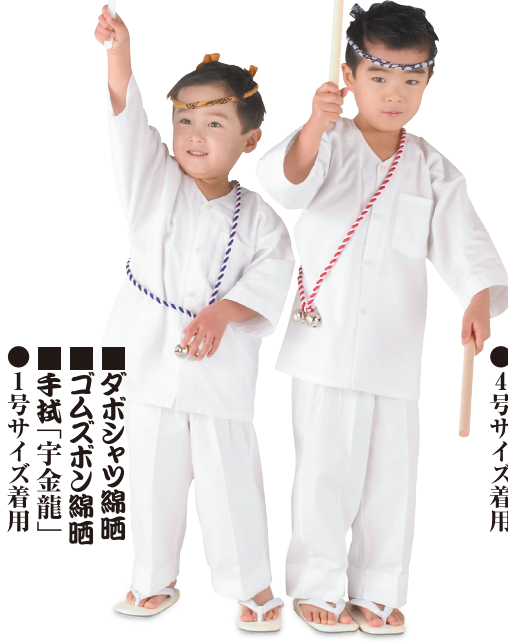
● 1号サイズ着用 ■ ダボシヤツ綿晒 ■ ゴムズボン綿晒 ■ 手拭「宇金龍」