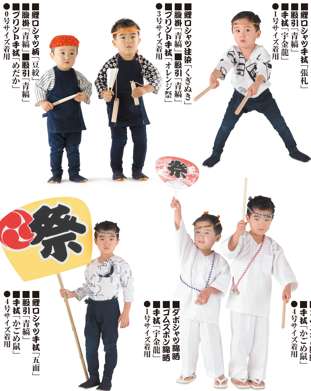
● 0号サイズ着用 ■ 鯉ロシヤツ柄「豆絞」 ■ 腹掛「青縞」 ■ 股引「青縞」 ■ フリント手拭「めだか」