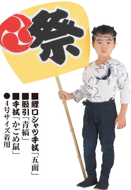
● 4号サイズ着用 ■ 鯉ロシヤツ手拭「五面」 ■ 股引「青縞」 ■ 手拭「かごめ鼠」